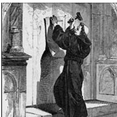
Luther kifüggeszti 95 pontját

A reformáció általános vonulatába tarto-zott a Biblia nemzeti nyelvre fordítása. Nem volt ez másként a magyar nemzet körében sem. A reformáció századában számos magyar nyelvű bibliafordítás készült, de sa-jnos egyik kísérlet sem tudta a teljes Bibliát