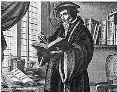
„Hiszed, hogy volna olyan-amilyen / magyarság, ha nincs — Kálvin? / Nem hiszem.” Illyés Gyula

Az evangéliumi egyszerűségű keresztyén egyházi szertartások. Vallotta Kálvin, hogy az egyház tanítása, szertartása, szervezete olyan legyen, amilyenek a Biblia rendeli. Különbözött ez a felfogás a lutheritól, mert aszerint minden maradhatott az egyházban, ami nem ellenkezik a Bibliával. A szertartások egyszerűsége révén Kálvin mindenki számára könnyen érthetővé tette az istentiszteleten történeteket. Másfelől az volt a célja mindezzel, hogy a Szentlélek vezetésével az istentiszteleten résztvevő hívő minél közvetlenebbül találkozhassék az Isten élő és neki szóló üzenetével, az Igével. Gondoljunk erre, amikor szertartásaink ünnepélyességének fokozása címen feleslegesen cirkalmazott mondatokkal, értelemzavaró pleonazmusokkal (szószaporításokkal, felesleges szóhalmozásokkal) tolaszunk Isten és az ember közé és nehe-