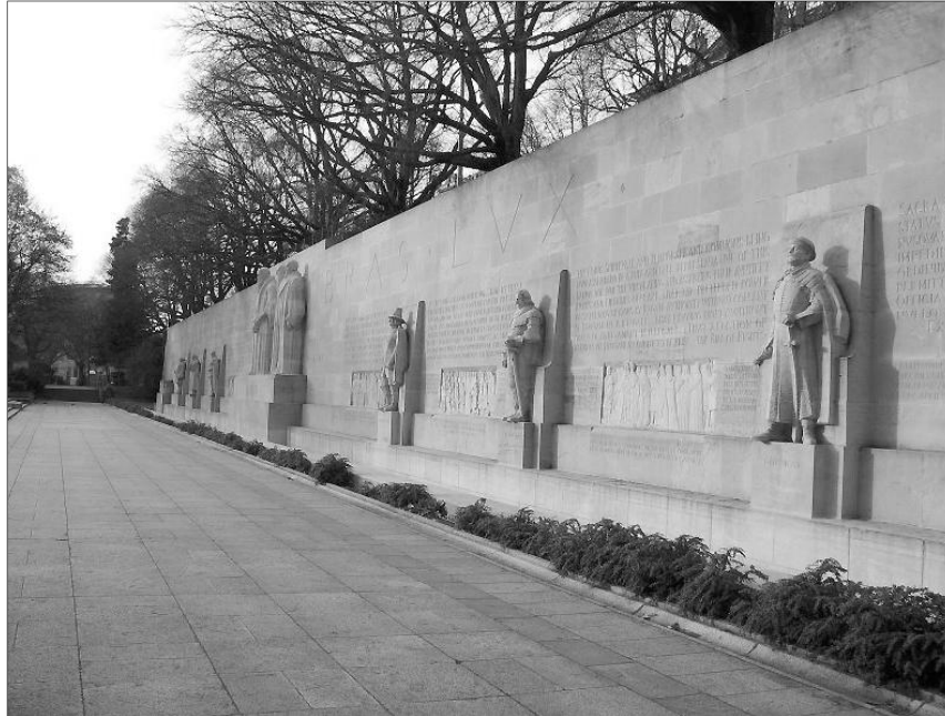
„Kálvin, Knox, Farel, Béza! S bika-fővel / a hadrakelt hit zord hadnagyai, / a Vilmosok! és Coligny és Cromwell / – ök néztek rám – s a szablys Bocskai!...” (Illyés Gyula: A Reformáció genfi emlékműve előtt, részlet). A Reformátorok fala keleti oldalán (képünkön jobbra) a „gyöztos erdélyi fejedelem” domborműve látható

Október végén az őszi évad első nagy egyházi ünnepe köszönt bennünket: a reformációra való emlékezés. 1517-ben, Wittenbergben Luther Márton ágostonrendi szerzetes és teológiai professzor e hó utolsó napján tette közzé híres 95 tételét, amellyel a Reformáció elindult diadalmos útjára, amely átjárta nemcsak az Egyházat, hanem a világot is.