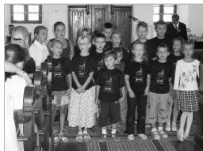
A bibliahét a gyermekek bizonyágtételével zárult

Mindkét rendezvény záróeseménye az idén 150 éves templomban tartott istentisztelet volt. A több mint két éve tartó templomrestaurálási munkálatok a programok ideje alatt is folytatódtak. Volt olyan nap,