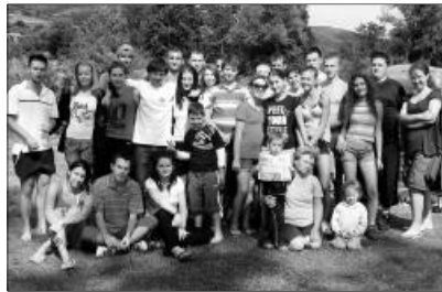
A kapcsolatépítés jegyében telt a csillagvárosi ifjak idei tábora

KAPCSOLATÉPÍTÉS – A CSILLAGVÁROSI IFI NYÁRI TÁBORA. Augusztus 7-9. között került megrendezésre Ifi-táborunk, amelyen régi és új arcok fordultak meg azzal a reménnyel, hogy egymást és a kegyelmes Istent megismerhessék. Célunk a kapcsolatépítés volt, tehát átértük, mit jelent az ember és ember közötti kapcsolat; ennek íratlan törvényei mélyen beleivódtak tudatunkba. Ebből a tapasztalatból kiindulva megtudhattuk azt is, hogy mit vár el tőlünk a Jóisten, a vele való kapcsolatunkat nézve.