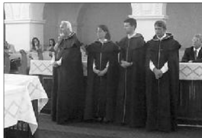
A lovagrend tagjai a bihari református templomban

ZARÁNDOKLAT A SZENT ISTVÁN-I SZELLEMISSÉG JEGYÉBEN. A Bihari Egyházmegye több gyülekezetébe is ellátogattak augusztus 11-én a magyarországi Szent István Lovagrend tagjai. Céljuk, hogy általalapító királyunk nemzetösszetartó szellemét, egy személyéhez kapcsolódó ereklyén keresztül körbehorozzák a Kárpát-medencében. Biharon, az egyházmegyei lelkészér-