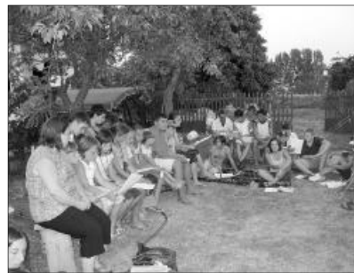
Ismerkedés egymással és az Igével. A biharszentjánosi és a mezőbaji fiatalok közös táborozása

A mezőbaji parókia udvara sátrótáborral változott. Nem a hegyek magasodtak mellettünk, hanem a templom tornya. Sátorverés után irány a Fekete-Körös! Egy nagy árnyas fa alatt volt a főhadiszállásunk. Elfértek alatta a biharszentjánosi, valamint a mezőbaji fiatalok együtt. Ünnepelesen megnyitottuk a keresztyén ifjúsági táborunkat. Ismerkedtünk, barátkoztunk a helybeliekkel. Ismerkedtünk az Igével is, tanulgattuk a Krisztus útján való járást. Ugyanis közös reggeli áhítatok után indultunk minden nap útnak a Körös partra, vagy a tamás-hidai romtemplomhoz, amely nem kis túra volt gyalog a 38 fokos melegben. Még jó, hogy közben jövet-menet meg lehetett mártózni a Körösben, vagy a kanálisban. Minden este a kirándulásból hazatérő mintegy ötven éhes fiatal terített asztal várta a kultúrotthonban, melyet a szorgos és vendég-