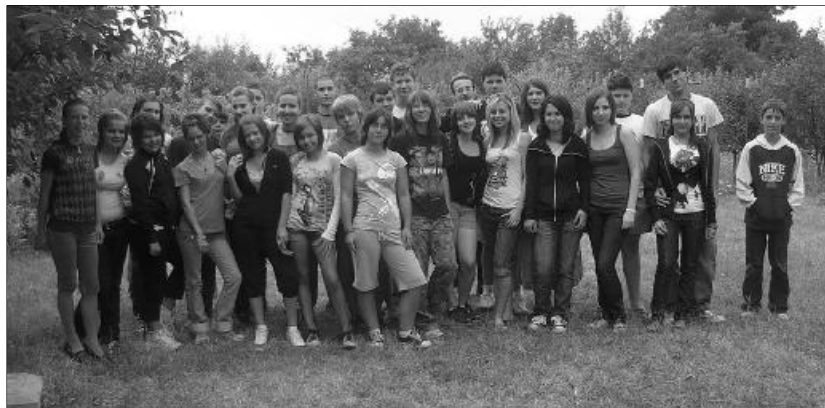
Idén immár kilencedik alkalommal került megrendezésre a gyantai evangélicus angol tábor

gyar nyelvű egyetem Romániában. Új távlatok nyíltak az Egyetem tizenhárom szakja számára: az alapképzésen túl immár négy mesterképzési szakot indítunk a 2010/2011-es tanévben, európai uniós pályázati források nyíltak meg előttünk. ISTEN SEGÍTSÉGÉBE vetett bizakodással indítjuk az új tanévet. Tesszük ezt akkor is, ha az új közoktatási törvénytervezet, még mindig nem olyan, amilyet egyházunk és testvéregyházaink szeretnének. Reméljük, hogy a törvénymódosítással kapcsolatos közös munkánknak, sorozatos közös tiltakozásunknak meglesz az eredménye, és a felekezeti oktatás, évszázados hagyományaihoz és a román alkotmány előírásaihoz képest, méltó helyre kerül az új törvényben. ÉS AKKOR – Isten engedelmeivel – az eljövendő tanévet jobb körülmények között kezdhetjük!