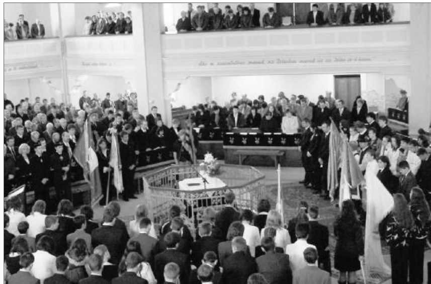
A Zilahi Református Wesselényi Kollégium évnyitó ünnepsége a Zilah-belvárosi templomban (archív felvétel)

Napjainkban sok mindent megkérdőjeleznek. Meg lehet kérdőjelezni a fenti címet is. Mi az, hogy református nevelés? És egyáltalán: van-e református nevelés? Persze, hogy van. Éppen úgy van, mint ahogyan van családi nevelés. Akkor is van, ha nincs. Mert a család, a legkisebb lelki (vagy lelketlen) közösség akarva vagy akaratlanul, tudatosan vagy tudatlanul rányomja bélyegét a benne felnövő gyermekekre.