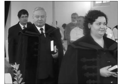
Vasárnap délelőtti istentisztelettel zárult a rendezvény, melyen Csűrű István megbízott püspök (középen) hirdetett igét