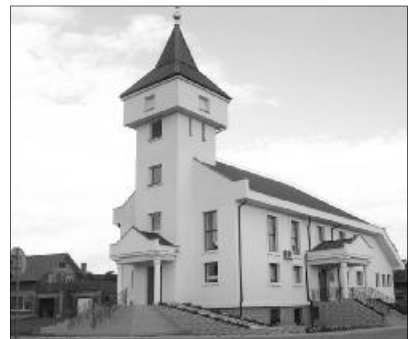
Közel kilenc évtized után ismét templomszentelésre került sor a Szilágysomlyói Egyházmegyében