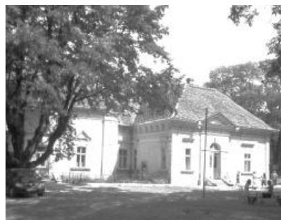
A hadadi Degenfeld-kastély

NYÁRI PROGRAMOK HADADON. A hadadi Degenfeld-kastély az idei nyár folyamán is több rendezvénynek, tevékenységnek ad majd otthont. Május 16-án immár