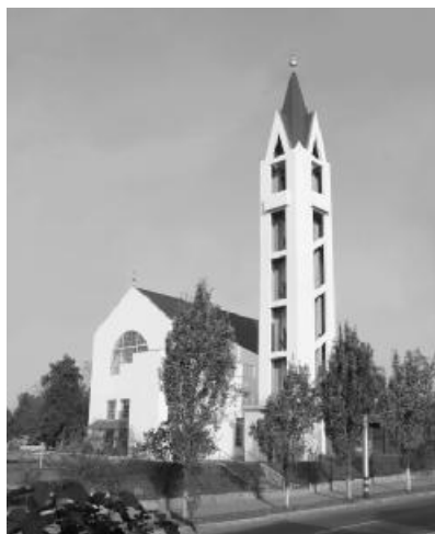
A Nagyvárad-rogeriuszi református templom. Hetente két alkalommal keresik fel a városnegyed reformátusait

Mindazoknak, akik gyülekezetünket csak sátoros ünnepeken látogatják, a gyülekezet örömeiről és nehézségeiről, eredményeiről adunk tájékoztatást. Családlátogatási tervünk szerint a gyülekezetünk területén élő reformátusokat keressük fel utcá-