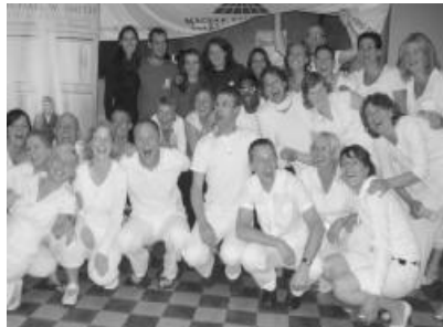
Nagy tetszést aratott a 70 tagú együttes, a nagyrészt fiatalokból álló közönség körében

ZILAHON LÉPETT FEL A SHIRCHADASJ. Április 30-án a zilahi Kálvineumban koncertezett a népszerű holland gospel kórus. Az elmúlt évek során, a mintegy 70 főt számláló csapat több alkalommal turnézott Magyarországon és a Kárpát-medence magyarok lakta területein. A programjuk minden évben megújul, energikus gospel zenével hirdetik az evangéliumot az egész világon. 2009-es turnéjuk egyetlen erdélyi állomása Zilah volt.