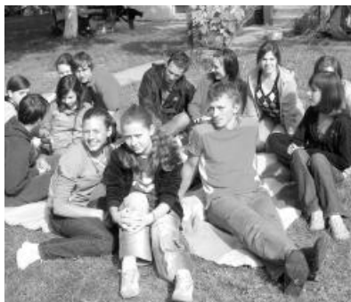
Jövőre is megrendezik a közösségépítő sátorozást Nagyvárad-Csillagvároson

CSILLAGVÁROSI IFI TOBORZÓ. Örömmel tudatjuk, hogy a május 8-9-én megtartott sátorozás elérte célját: megszerettettük