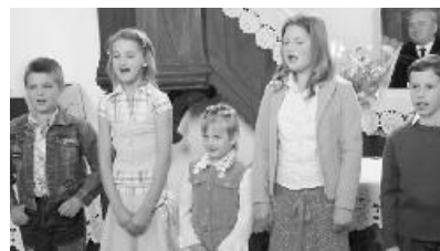
A vallásórás gyermekek az édesanyákat köszöntötték szavalattal és énekszóval