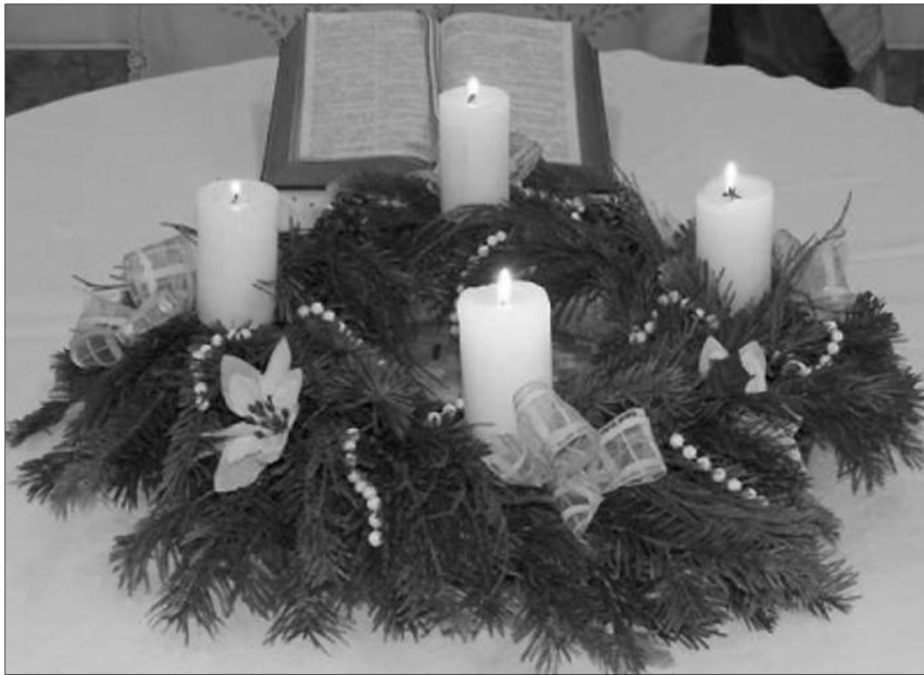
Az első karácsony, amikor az adventi koszorú az áhítatos várakozás részévé vált, 1860-ban volt. A berlini árvaházban Johann Heinrich Wichern evangélikus lelképásztor az ünnep előtt gyertyákkal díszített kör alakú, abroncsos csilláron jelezte a még karácsonyig hátra lévő idő múlását

Íme az ajtó előtt állók és zörgetek, ha valaki meghallja az én szómat és megnyitja az ajtót, bemegyek ahhoz és vele vacsorálok és ő envelem. (Jel 3,20)