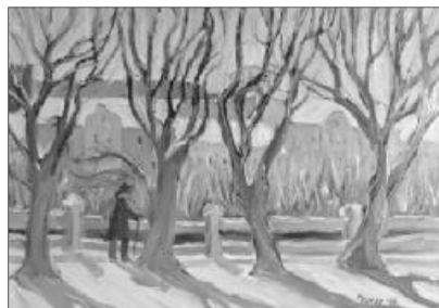
Tolnay Tibor Körösparti fák című alkotása

Nem volt családban olyan esemény, nem múlt el úgy ünnep, hogy ne jelent volna meg szerényen, hóna alatt egy képpel: én ezt tudom ajándékba adni. Először a szemmagasságig, aztán egyre feljebb, a plafonig értek a képek és költöztek be a parókia falai közé elsősorban közös szerel-