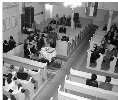
„Tied a dicsőség...” Fialatok és idősebbek egyaránt kíváncsian hallgatták a Tálcium muzsikáját

A vasárnap délutáni istentiszteletet követően, a sokak által már jól ismert Tálcium keresztyén ifjúsági zenekar fellépésére került sor Köröstárkányban, október 15-én.