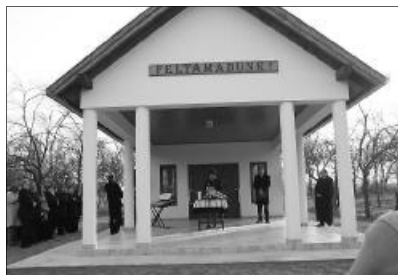
A feltámadás reménységét hirdeti a lompérti ravatalozó

Az igehirdetés után a gyülekezetünk énekara szolgált verssel és énekekkel. Ezután jómagam köszöntöttem az egybegyűlteket, vendégeket és helybelieket egyaránt. Mindenkinek a figyelmébe ajánlottam a ravatalozó homlokzatán olvasható feliratot.