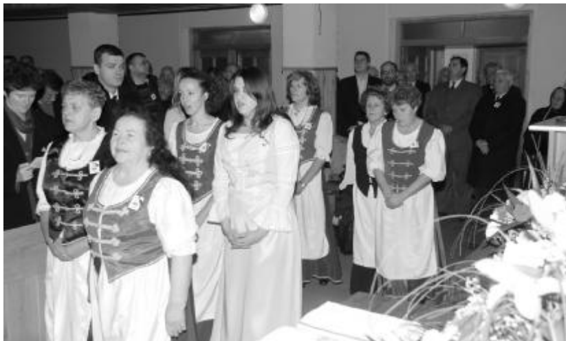
A Nagybánya-Újvárosi Nőszövetség tagjai nemzeti viseletben vonultak az istentiszteletre

Nőszövetségünk szolgálatát sokrétűség jellemzi. Szívügyünk beteg testvéreink láto-