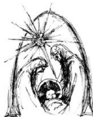
Ünnepi lapszámunkat Bak Sára grafikáival illusztráltuk

Obed szolgálai mivolta, csodálatos születése, Krisztust vetíti előre. Ahogyan örült Naómi, ölébe vette és gondozta ezt a fiúgyermeket, úgy kell nekünk is örvendezni Krisztus Urunknak. Isten, Fiában szolgáló formát vett fel értünk. Máriától való születése által Isten emberré lett, hogy olyan közel érezzük, tudjuk, lássuk magunk mellett, mint saját gyermekeinket, unokáinkat. Karácsonyunk lélekleben üres marad, ha szívünk nem telik meg Istennek értünk szolgáló szeretetével, azzal a mennyei gondviselő irgalommal, mely nélkül kiszolgáltatottaknak és a bűnnek, reménytelenségnek szolgálai maradunk. Jézus szolgálai mivoltát figyelve telik meg szívünk örömmel, felsza-