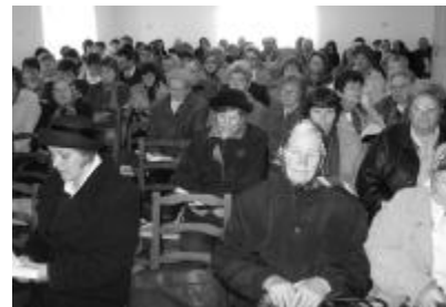
Fokozott érdeklődés jellemezte a Zilahy Egyházmegeye magyarkececi nőszövetségi találkozóját