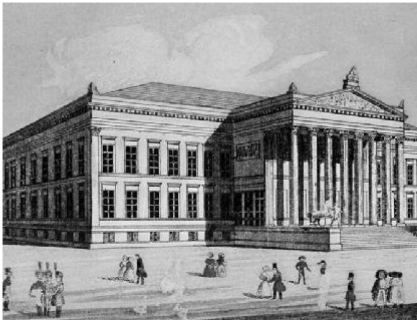
A Nemzeti Múzeumban alakult 1907. szeptember 18-án az Országos Református Lelkészegyesület

1917. november 2-án békekezdeményezési javaslattal fordult az ORLE a genfi református lelkészek egyesületéhez. Nem rajta múlt, hogy az antant pártján álló svájciak az egyház és a lelkészeket az kiáltották, hogy ismerjék el azt, hogy az Osztrák-Magyar Monarchiát terheli elsődlegesen a háború kiobbantásáért a felelősség. Ezt nem teheték meg, mert nem volt igaz.