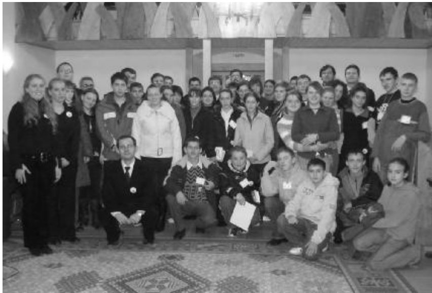
Az idei egyházkerületi bibliavetélkedő résztvevőinek népes csoportja a magyarkéci templomban

Idén az Érmelléki Egyházmegye szervezte Magyarkécen november 17-én, a Királyhágómelléki Református Egyházkerület Bibliaismereti vetélkedőjét. Az egyházkerület 9 egyházmegyéjéből 8 képviseltette magát.