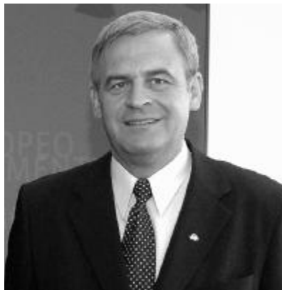
A szavazatok 3,5 százalékával Tőkés László az erdélyi magyarok európai parlamenti képviselője!