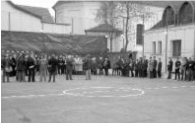
Pályára léptek. Az ünnepi alkalomra rendbehozották és feldíszítették a sportlétesítményt