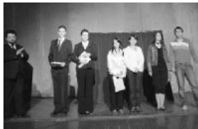
A lugosi színházban tartott galaesten díjazták a versenyzőket