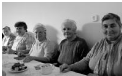
A száldobágyi nősövétség néhány tagja csigakészítés közben