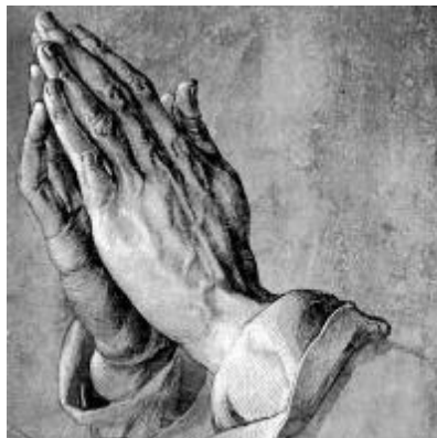
Albrecht Dürer: Imádkozó kezek

Szebb, igazabb, boldogítóbb nincs annál a világon, mint amikor valaki önként, őszintén, ha kell áldozatot hozva, ha kell üldöztetést, szenvedést is elviselve szeret, szereti Azt, aki Teremtője és szereti azt, akit Istene mellé rendelt, hogy szolgálja. Boldogságunk csúcsa az, amikor minden áron, bármilyen áron szolgálni akarom embertársamat, Krisztus lelkével, Őérette, az Atya dicsőségére.