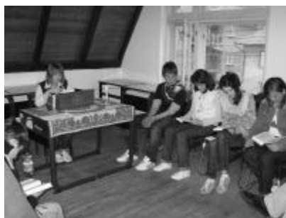
Az egyházmegye 17 gyülekezetéből 128 személy – ifjak és lelkipásztorok – vett részt a több mint 24 órás bibliaolvasó maratonon

A Biblia a földkerekség egyik legrégebbi könyve: az egyetemes irodalom gyöngyszeme, kultúrkinca, a Könyvek Könyve. Legnagyobb értéke, hogy általa Isten szól a mindenkori olvasóhoz. Április 11-12-én a Zilahi Egyházmegye Bibliaolvasómaratonát szervezett. A gyülekezetek ifjai több mint 24 órán át folyamatosan, egymást váltva olvasták a Szentírást.