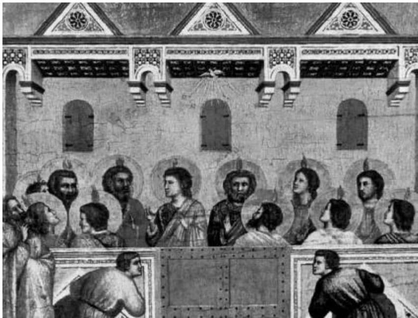
„És megtelének mindnyájan Szentlélekkel.” Giotto di Bondone: Pünkösd

Pünkösd a Szentlélek kitöltetésének örömnépe, az anyaszentegyház születésnapja. E napon szállt alá a Szentlélek az apostolokra. A Szentlélek, a közöttünk lakozó és a világ végéig velünk maradó Isten, a maga harmadik személyében. Istennek Lelke Jézust e napon újra élővé és hatóvá akarja tenni életünkben.