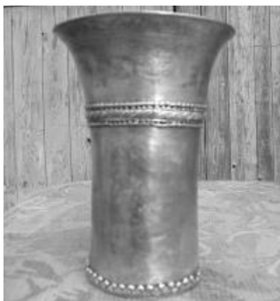
36 év után kapta vissza úrasztali serlegét a vervölgyi gyülekezet