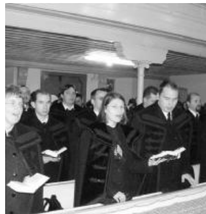
Tizenhat ifjú lelkéssel gyarapodott egyházkerületünk lelkészi kara, a krasznai kihelyezett egyházkerületi közgyűlésen tartott beiktatás során