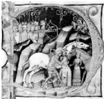
A korabeli ábrázoláson a lovagkirály megment magyar leányt az őt elrabolni próbáló kun vitéztől

1077-et írták, amikor Lászlónak a nép akaratából, jóllehet Salamon még életben