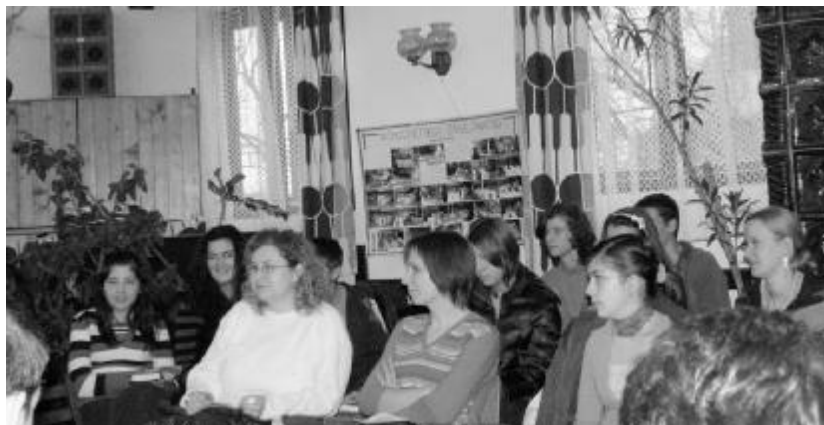
Vidámság, kikapcsolódás, lelki épülés jellemezte a biharszentjánosi ifjúsági napot