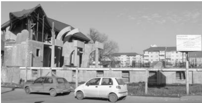
Az építkezés helyszíne, jelenlegi állapotában

– Ami a múltban jó volt, azt meg szeretnénk tartani. Az Új Ezredév Református Központ építésére szeretnénk koncentrálni, úgy, hogy ne menjen a gyülekezeti élet rovására. Közel a 20. forradalmi évforduló. Tőkés László püspöknek köszönhetjük, hogy az építkezés egyáltalán elkezdődhetett. Általa Európa támogatását is magunk mellett szeretnénk.